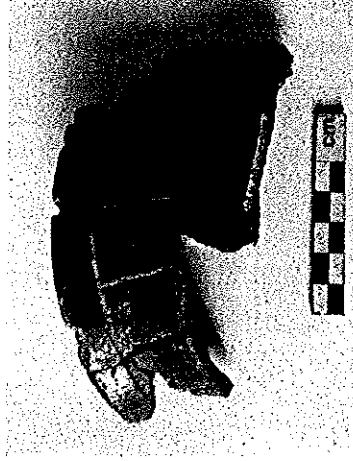
Fragmento del Tipo Urita Gubiado Inciso